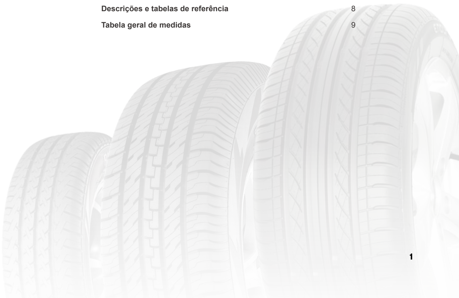
Tabela geral de medidas 9