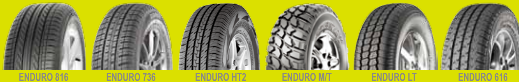
TABELA GERAL DE MEDIDAS